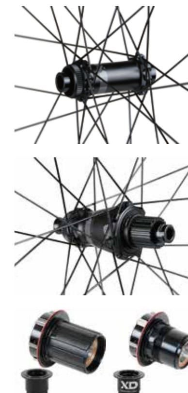
SHIMANO HG フリーボディ (別売り)